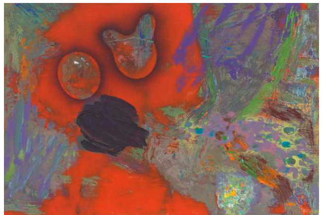
Christophe Robe, Sans titre, 2020, acrylique sur toile, 20 x 30 cm