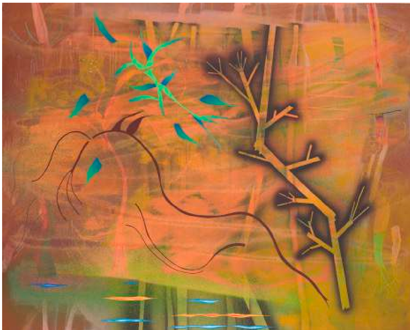
Christophe Robe, Sans titre, 2021, acrylique sur toile, 200 x 250 cm