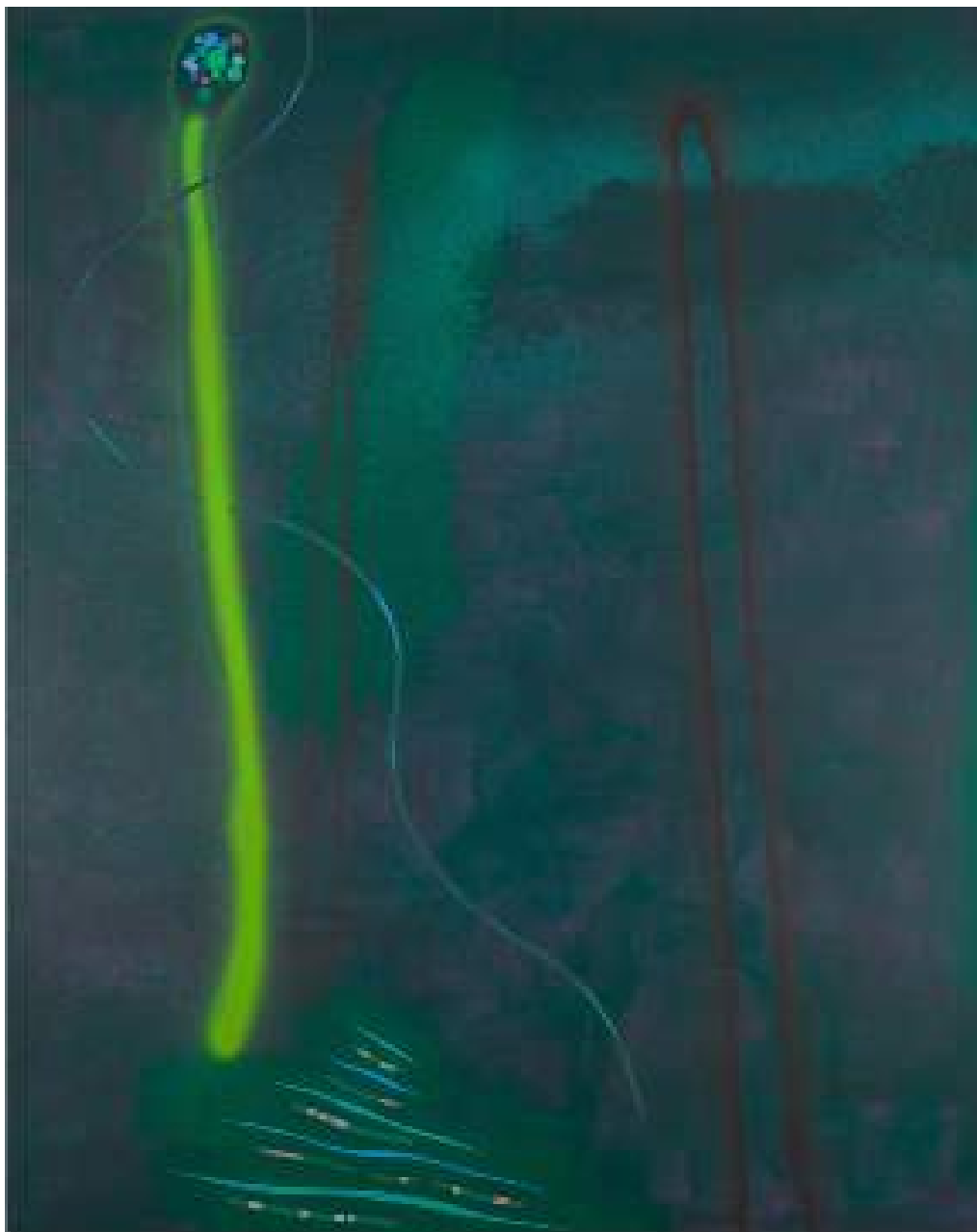
Christophe Robe, Sans titre, 2019, acrylique sur toile, 250 x 200 cm