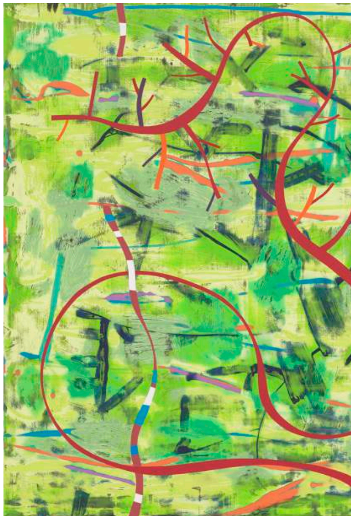
Christophe Robe, Sans titre, 2021, acrylique sur toile, 80 x 60 cm