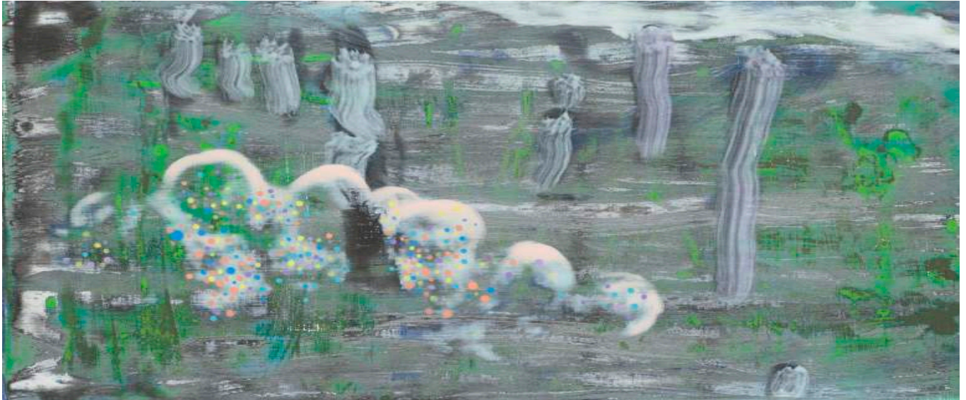
Christophe Robe, Sans titre, 2020, acrylique sur toile, 15 x 30 cm

« Certains peuvent voyager à travers le monde et ne rien en voir. Pour parvenir à sa compréhension, il est nécessaire de ne pas trop en voir, mais de bien regarder ce que l'on voit. » Giorgio Morandi