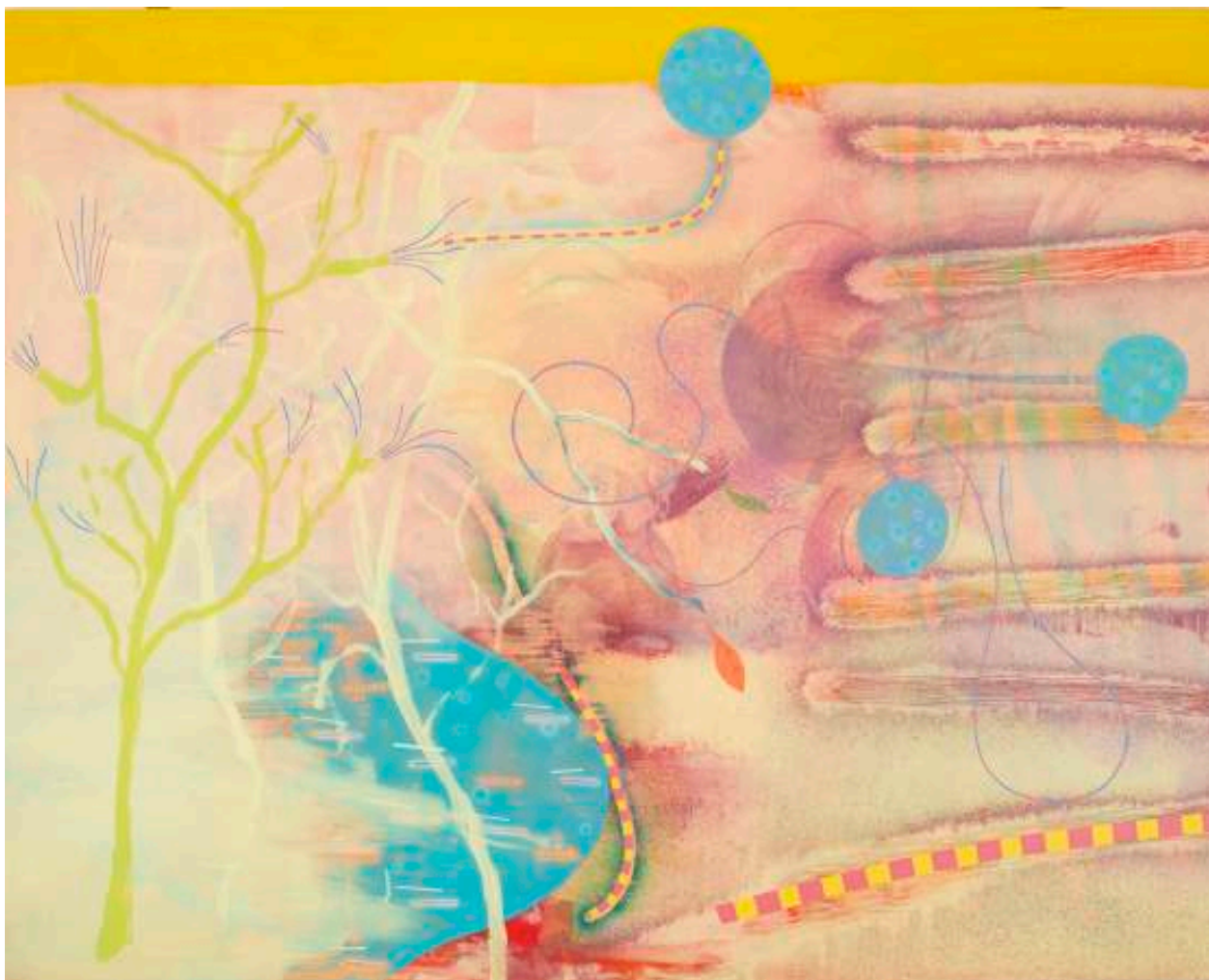
Christophe Robe, Sans titre, 2019, acrylique sur toile, 200 x 250 cm