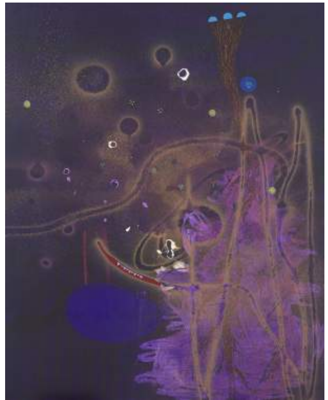
Christophe Robe, Sans titre, 2020, acrylique sur toile, 190 x 240 cm