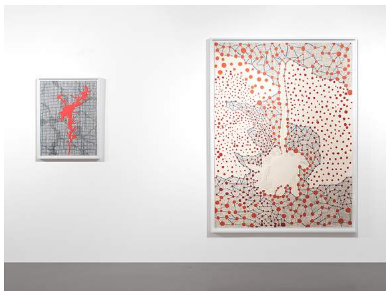
Vue de l'exposition Trames et variations 2018 à la Galerie Jean Fournier