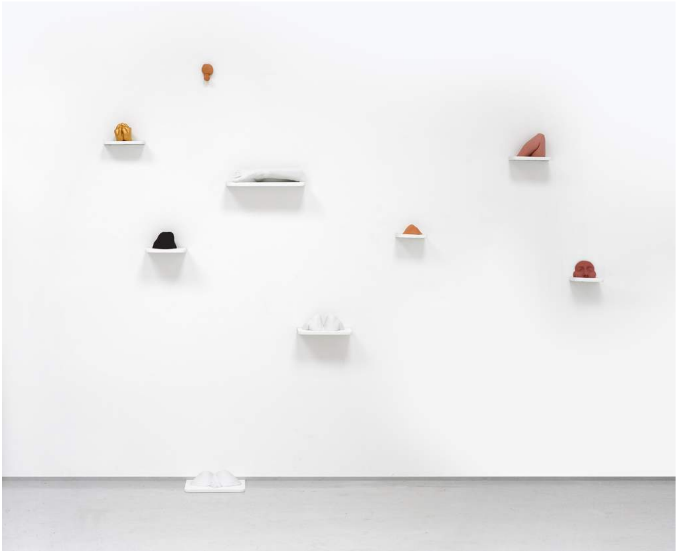
Ensemble de pièces, 2022, porcelaines teintées dans la masse, étagères, bois, dimensions variables