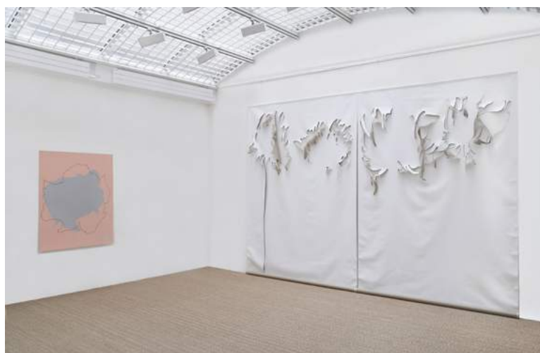
Vue de l'exposition Frédérique Lucien 2006 à la Galerie Jean Fournier