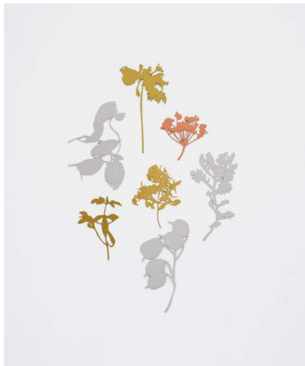
Jardin d'hiver , 2023, aluminium, cuivre, laiton, 62 x 42 cm (l'ensemble)