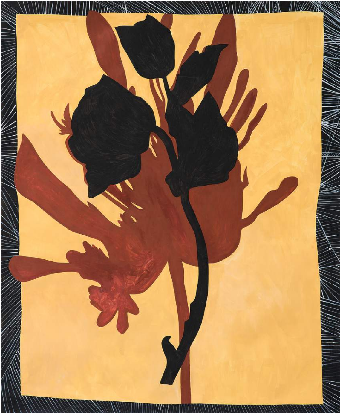
Lilium III , 2023, acrylique sur papier, collage, 185 x 150 cm