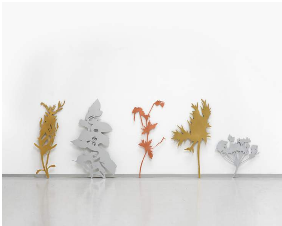
Leaves of grass, 2022-2023, laiton, aluminium, cuivre, dimensions variables env. 90 x 50 x 0,5 cm