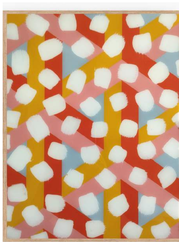
Fixé sous verre (1) , 2022, acrylique sur verre, 30 x 40 cm