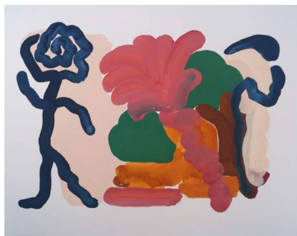
En avant, 2020, gouache sur papier, 30 x 40 cm