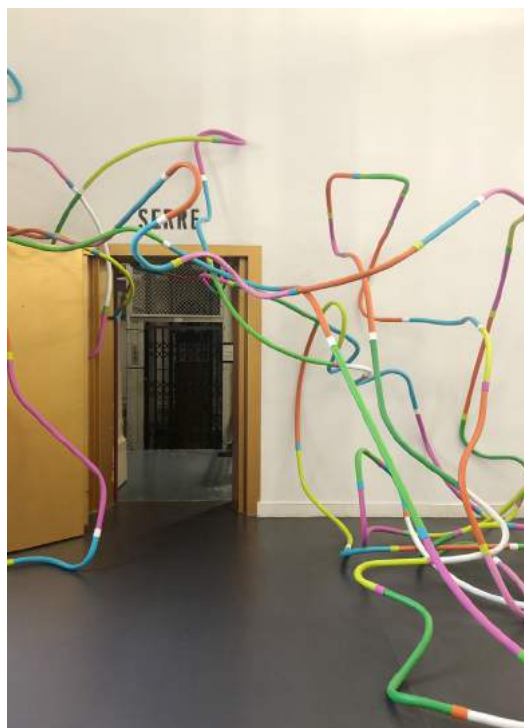
Vue de l'exposition Déranger les murs , Labanque, Bethune, 2021