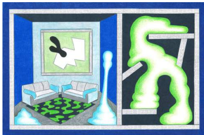
Intérieur avec peinture abstraite, crayon et crayon de couleur sur papier, 29,7 x 42 cm, © Droits réservés / Courtesy Galerie Jean Fournier