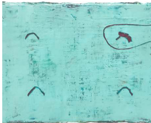
Bleu clair, quatre buttes , 2020, huile sur toile, 24 x 19 cm

1 Bernard Lallemand, extrait de «Terre et ciel, La peinture entre espace et territoire».