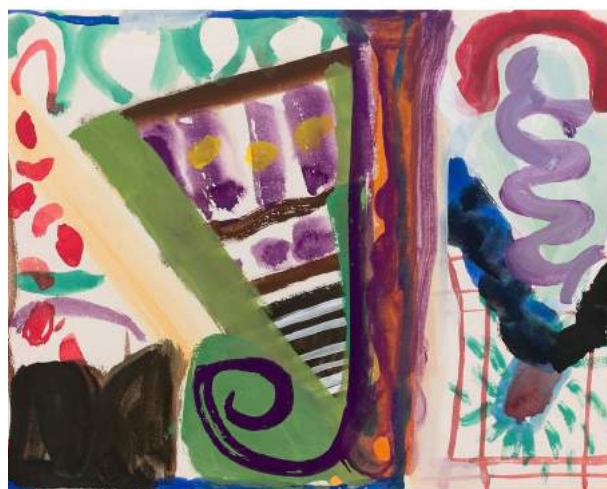
Parce que c'est un J, pour Jean , 1980, gouache sur papier, 24,5 x 32 cm © Droits réservés / Courtesy Galerie Jean Fournier

Comme en a témoigné la rétrospective du Centre Pompidou en 2022, l'œuvre de Shirley Jaffe est aujourd'hui reconnue et incontournable. Son œuvre est d'abord lyrique puis géométrique, située quelque part entre le découpage des formes de Matisse et la vibration musicale de Mondrian. Jaffe est indissociable de l'histoire de la Galerie Jean Fournier. Ses pièces contiennent en elles les fondements de l'art moderne, puis ceux de la Tabula Rasa de l'art d'après-guerre. Comme dans le jazz, sa peinture a une spontanéité et une vitalité mêlées à un penchant pour le collage, où la couleur est l'axe unificateur de sa peinture, qu'elle décrit finalement comme "permettant aux gens de regarder sans juger". Avec Parce que c'est un J, pour Jean , Jaffe rend hommage à la figure tutélaire de Jean Fournier, marchand d'art, mais aussi homme de lettres.