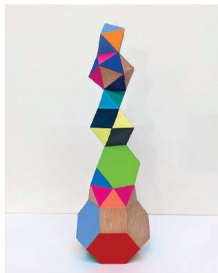
Totem n° 10, 2021, peinture acrylique sur hêtre massif, 51 cm x 15 cm