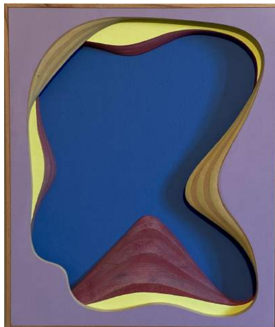
Sans titre, acrylique sur bois, 46 x 36 cm