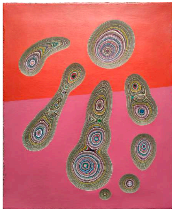
Patibulaire, 2021, acrylique sur toile, 35 x 27 cm