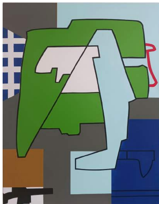
Atterrisseur , 2022, huile et acrylique sur toile, 100 x 73 cm