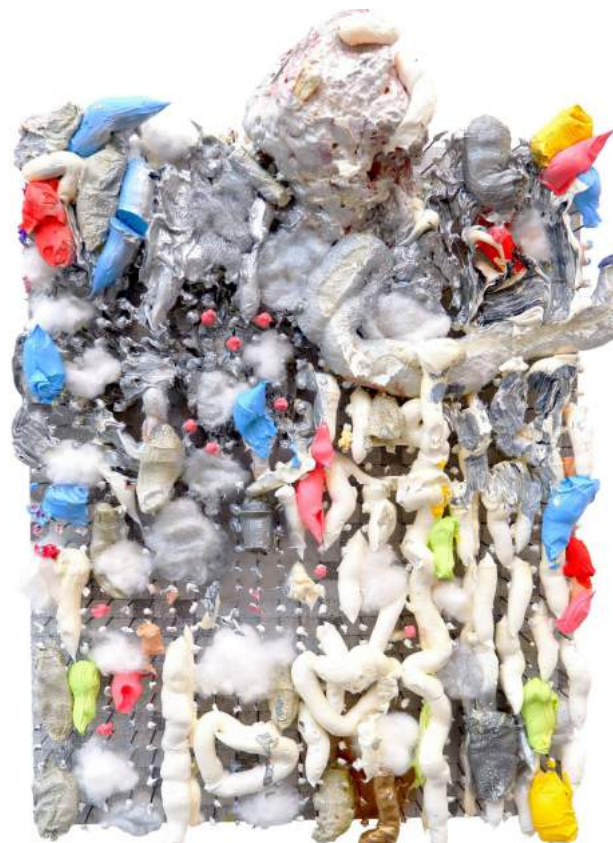
Hiver , 2020, huile et techniques mixtes sur clous, 39 x 29 cm

Sous un abord abrupt, se révèle, petit à petit, des raffinements insoupçonnés et, derrière une forme de dérision bravache, une foi intacte dans la force archaïque de l'art.