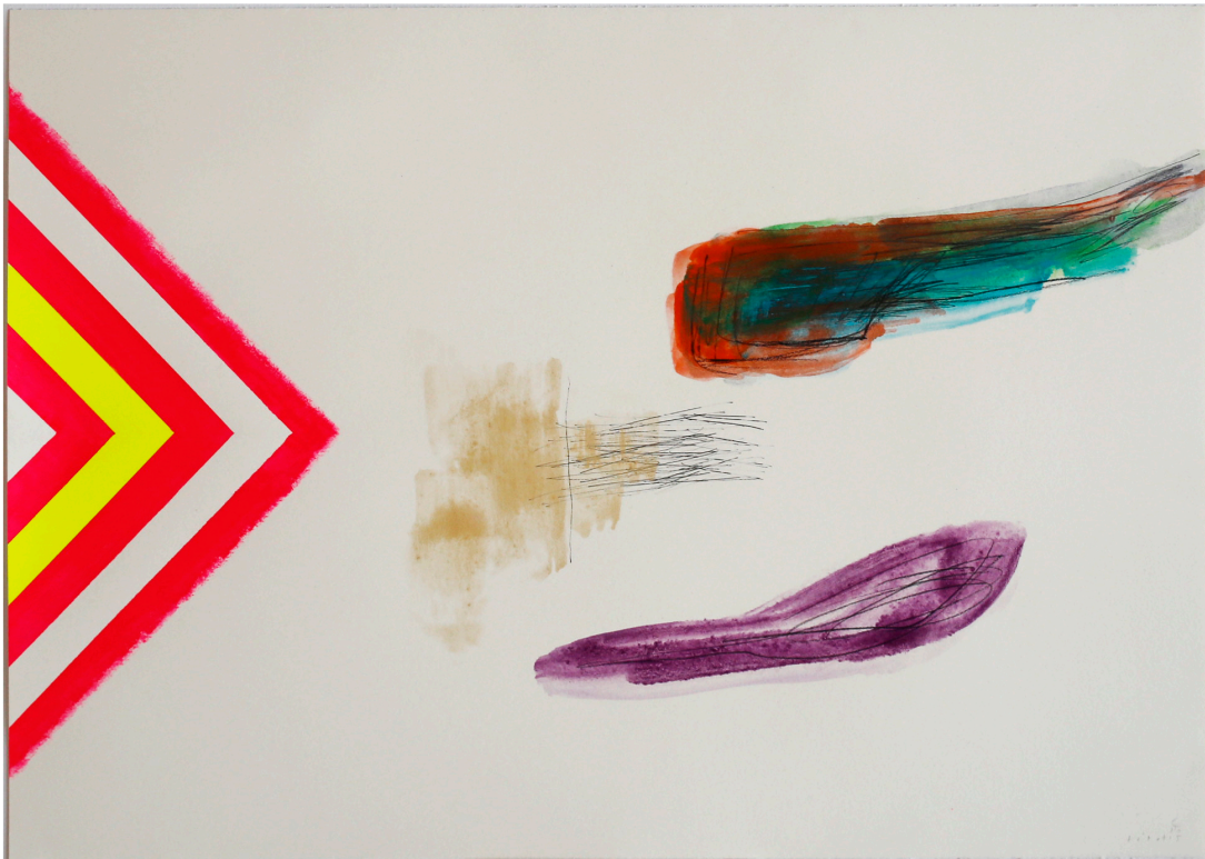
Sans titre, 2015, huile et acrylique sur papier, 50 x 70 cm