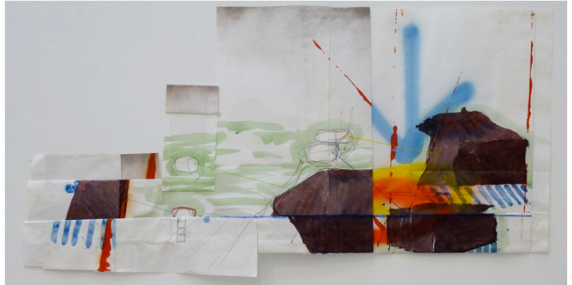
Panorama #9 , 2013, mine de plomb et aquarelle sur papier, 45 x 89 cm