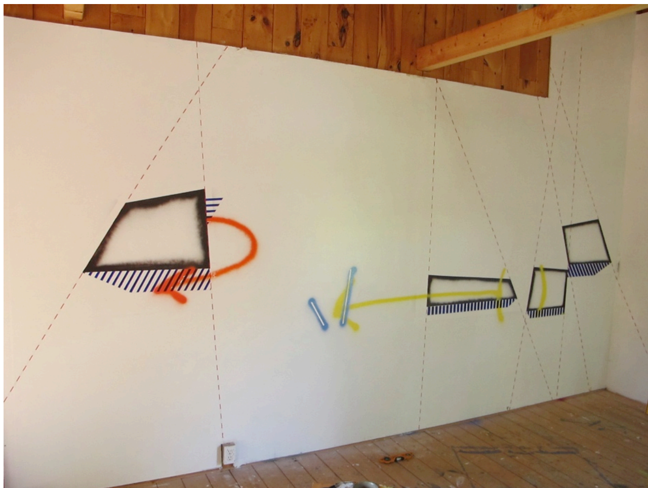
Panorama, œuvre en cours (détails), été 2013, vue de l'atelier