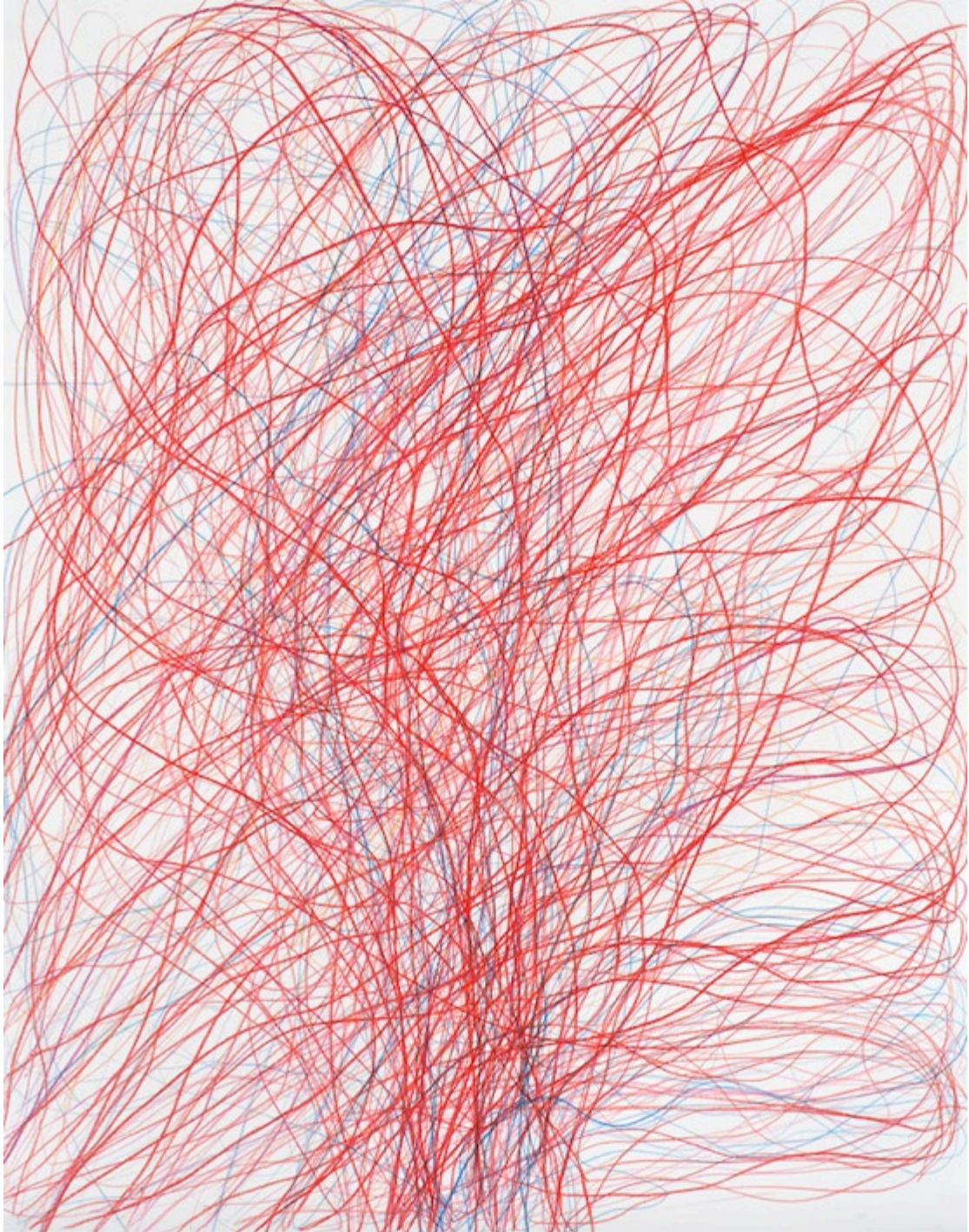
Giljan Gelzer, Sans titre, 2016, crayon de couleur et mine de plomb sur papier, 140 x 110 cm