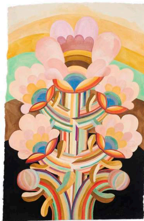
Série Fleurs , gouache sur papier en coton fait main, 77 x 50 cm, 2022 © P. Antoine / Caroline Rennequin / Courtesy Galerie Jean Fournier

La série Libération , réalisée sur papier journal, ouvre l'exposition et ancre le travail dans l'actualité tout en l'articulant avec des